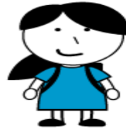
CBS Prinses Maxima

Klik op het icoon om het rapport te downloaden: