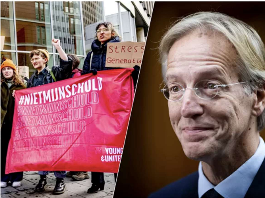
▲ Studenten houden een actie voor de deur van het ministerie van OCW/Robbert Dijkgraaf, demissionair minister van Onderwijs, Cultuur en Wetenschap